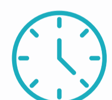
TABLE RONDE 2